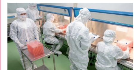
细胞委托开发及生产服务