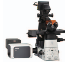
超分辨率共聚焦显微镜系统“AX with NSPARC”

尼康的“生命科学解决方案”,运用其拥有100余年历史的显微镜技术,将各种生命现象可视化并进行解析,为生物科学的研究和制药领域的进步做出贡献。“眼部护理解决方案”则运用了搭载尼康自主技术的眼科仪器和系统,为眼疾的早期发现以及生活品质的提高做出贡献。“细胞委托生产解决方案”,通过再生医学用细胞、基因治疗用细胞的委托开发和生产,为日本再生医学的实际运用和发展做出贡献。在医疗健康事业中,尼康通过先进的光学技术、影像处理、解析技术等核心科技,提供以上三种解决方案。在人类寿命不断延长的时代,尼康把全人类的健康视为重中之重,致力于为更多人带来健康和幸福。