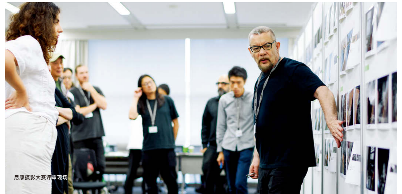
尼康摄影大赛评审现场