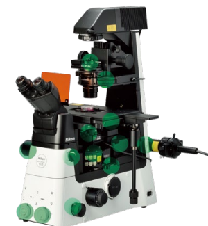
内置传感器检测各部状态

研究级倒置显微镜ECLIPSE Ti2中搭载的“辅助向导功能”，是由尼康影像中心的结果反馈衍生而来的。结合来自内置传感器和内部相机的实时数据，可以帮助用户完成实验设置和故障排除。并有效避免人工误差，帮助研究人员更有效、便捷地进行科学研究活动。