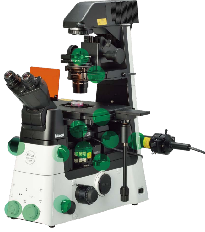
内置传感器检测各部状态

研究级倒置显微镜ECLIPSE Ti2中搭载的“辅助向导功能”，是由尼康影像中心的结果反馈衍生而来的。结合来自内置传感器和内部相机的实时数据，可以帮助用户完成实验设置和故障排除。并有效避免人工误差，帮助研究人员更有效、便捷地进行科学研究活动。